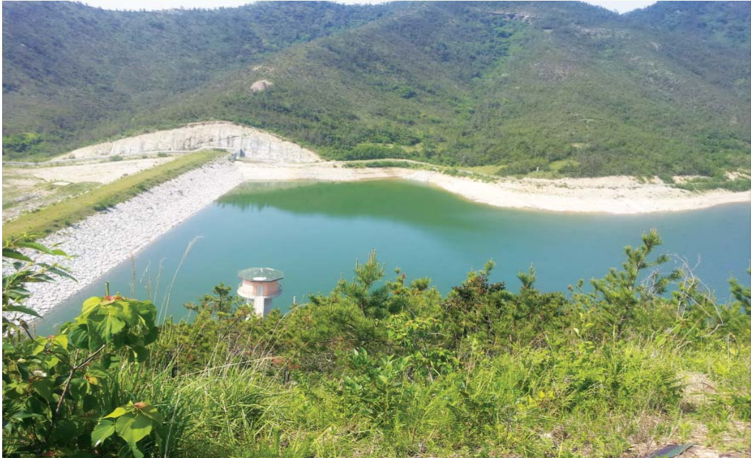
[ 도초 죽연 상수도 수원지 ]

도초 죽연 상수도 수원지는 유역면적 0.38km 2 , 저수량 500천톤으로 맑고 깨끗한 원수를 정수장에서 취수 및 정수하여 도초면 본도 전역에 안전하고 깨끗한 상수도를 공급 중에 있음.